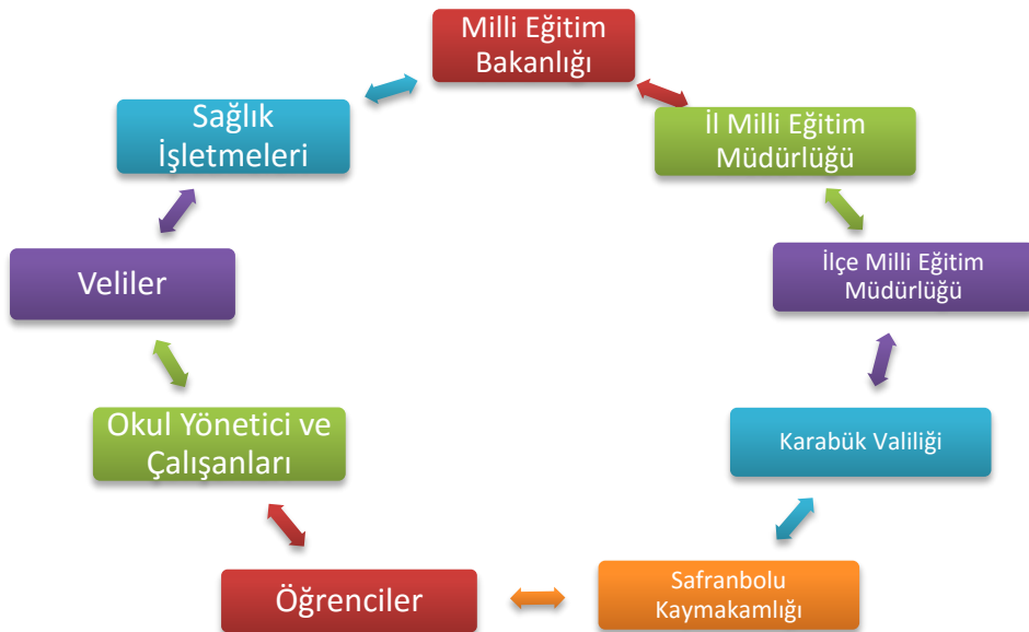
Şekil 2: Paydaş listesi

Okulumuzun temel paydaşları öğrenci, veli ve öğretmen olmakla birlikte eğitimin dışsal etkisi nedeniyle okul çevresinde etkileşim içinde olunan geniş bir paydaş kitlesi bulunmaktadır. Belirlenen paydaşların idarenin hangi ürün ve hizmetleriyle ilgili oldukları, idareden beklentileri, bu paydaşların idarenin ürün ve hizmetlerini nasıl etkilediği ve etkilendiğinin belirlenmesi amacıyla "Paydaş Anketi" geliştirilmiştir. Paydaşlarımızın görüşleri anket, toplantı, dilek ve istek kutuları, elektronik ortamda iletilen önerilerde dâhil olmak üzere çeşitli yöntemlerle sürekli olarak alınmaktadır.